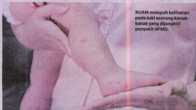
RUAM melepuh kelihatan pada kaki seorang kanak-kanak yang dijangkiti penyakit HFMD.