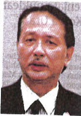
Dr Noor Hisham Abdullah

"Hasil keputusan menunjukkan dua daripadanya ialah cacar air, manakala satu lagi HFMD," katanya dalam ciapan di Twitternya, semalam.