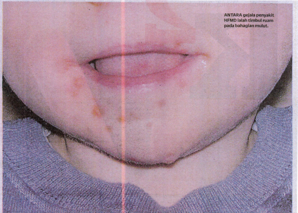
ANTARA gejala penyakit HFMD ialah timbul ruam pada bahagian mulut.