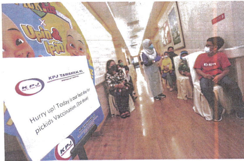
Last shot: A nurse attending to children before their turn for vaccination at KPJ Tawakkal in Kuala Lumpur.

It's a quiet affair at most vaccination centres as curtains come down