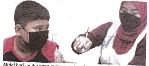
Mulai hari ini ibu bapa mahu mendapatkan suntikan vaksin COVID-19 bagi anak, perlu ke klinik swasta dengan bayaran tertentu.