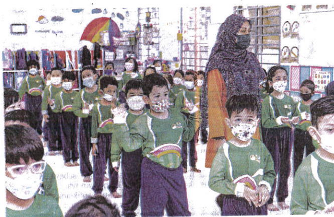
PARA pengusaha taska atau tadika kini menjalankan langkah-langkah pencegahan HFMD.

anda berjumpa dengan doktor bagi pemeriksaan selanjutnya," katanya.