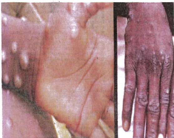
Individu dijangkiti cacar monyet akan mengalami lepus di muka dan badan.

Disinfeksi atau nyuhkuman permukaan yang tercemar