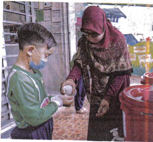
PENGENDALI tadika perlu mempertingkatkan kebersihan premis sekerap mungkin bagi mengelakkan jangkitan kes HFMD dalam kalangan kanak-kanak.

ini sehingga hari terakhir minggu epidemiologi (ME) 21/2022 (28 Mei), sejumlah 65,535 kes HFMD telah dilaporkan iaitu peningkatan 27 kali ganda berbanding tempoh sama tahun lalu (semasa pandemik Covid-19) iaitu 2,333 kes.