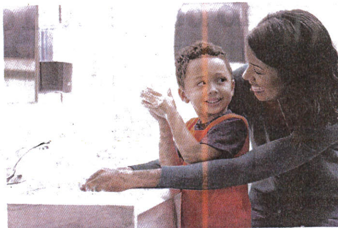
CUCI tangan dengan rapi dapat menghindarkan diri daripada jangkitan HFMD.

"Jika rawatan tersebut tidak memberi kesan dan keadaan pesakit semakin lemah, sila bawa anak-anak