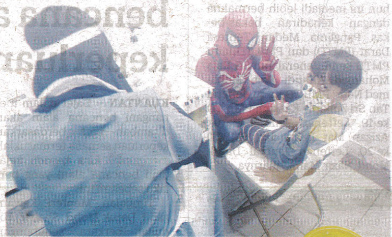
KANAK-KANAK bawah 12 tahun yang belum menerima vaksin berisiko mengalami komplikasi serius jika dijangkiti Covid-19. – GAMBAR HIASAN

Namun, harga runcit maksimum yang ditetapkan tidak termasuk caj perkhidmatan dan caj