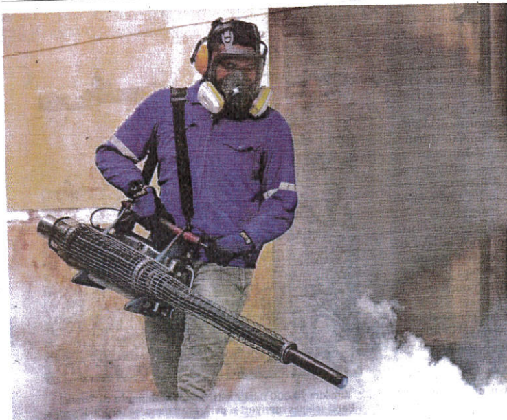
Selangor merekodkan 36 lokaliti kawasan panas, tiga di Kuala Lumpur dan Putrajaya serta masing-masing satu di Melaka dan Sabah.